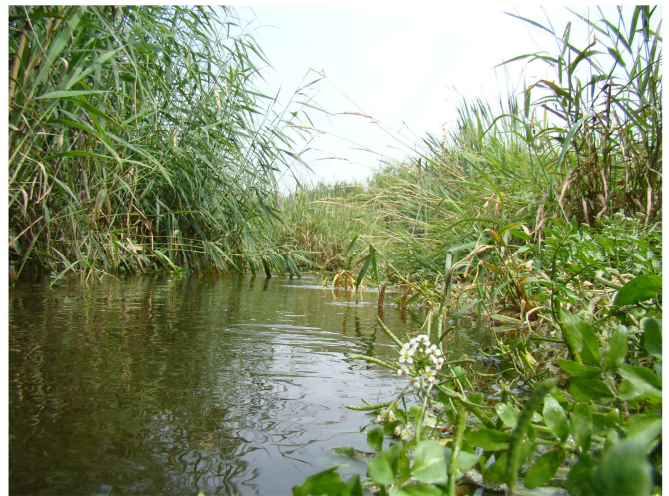
Bild: Referenzpriel auf Höhe des Elbedeichkilometers 19+500

Im Rahmen dieser Bachelorarbeit wurden verschiedene Varianten zur Herstellung eines Süßwassermarschprielis gegenübergestellt. Der Priel soll dem stetigen Rückgang des vom Aussterben bedrohten Schierlings-Wasserfenchels entgegenwirken und neuen Naturraum im Deichvorland der Elbe schaffen. Von besonderer Wichtigkeit war es, die Prielanlage so zu planen, dass sie den speziellen Ansprüchen des Schierlings-Wasserfenchels an sein Habitat entspricht.